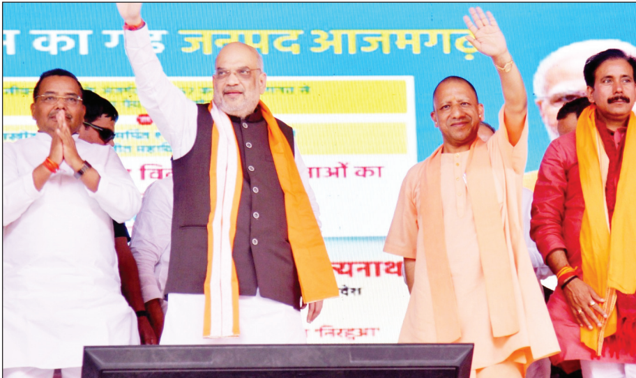
आजमगढ़ में केंद्रीय गृहमंत्री अमित शाह, मुख्यमंत्री योगी आदित्यनाथ जनता का अभिवादन स्वीकार करते हुए।